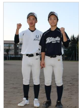
インタビューに答えてくれた今野選手(右)と遠藤主将(左)